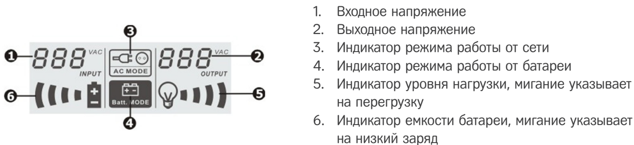
Рис. 2-2 ЖК-дисплей